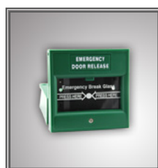
Bouton Exit Ouverture d'urgence