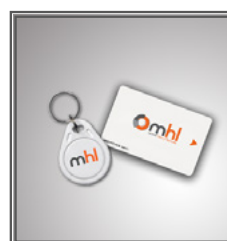
Badges RFID Porte-clés ou Carte crédit