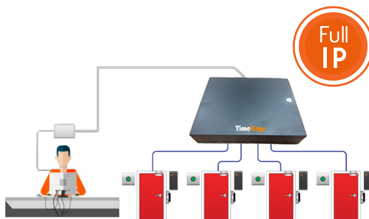
- SCHÉMA TECHNIQUE AVEC 4 PORTES -