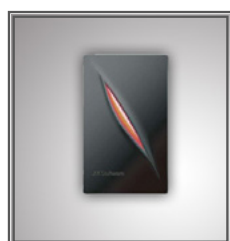
Terminal de badge RFID TK-KR101