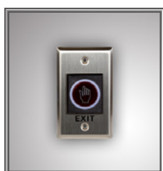
Bouton Exit TK-KR1-1